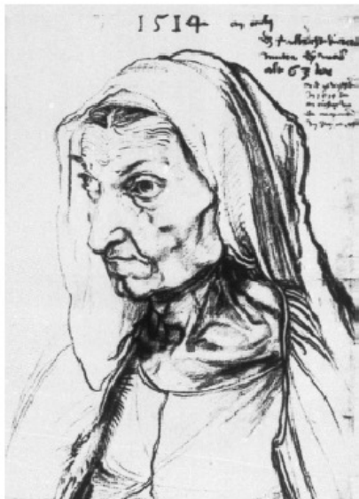
„Dürers Mutter“ mit 63 Jahren (1514)