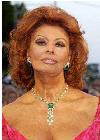
Sophia Loren mit 63 Jahren (geb. 20.09.1934)