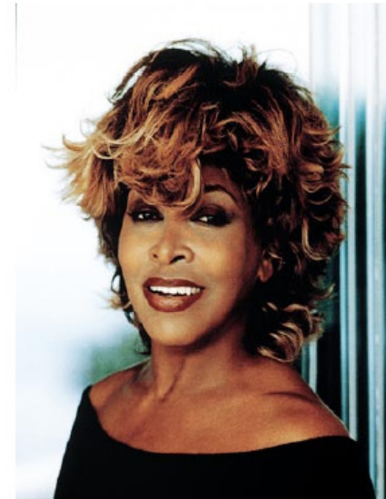
Tina Turner mit 70 Jahren (geb. 26.11.1939)