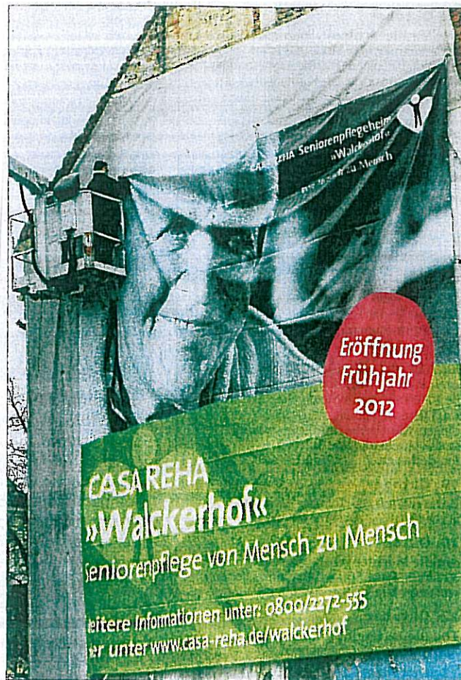
Das neue Plakat an der B27 wird aufgehängt.